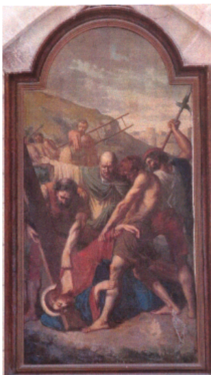
Station 9 du Chemin de Croix

Notre association aura la responsabilité de la restauration des cadres. Un éclairage ponctuel des stations est prévu. Nous sommes persuadés que cette rénovation attirera encore plus de visiteurs et de touristes, confirmant la vocation des Amis de Cléry qui est d'améliorer le patrimoine culturel de notre cité dont la basilique reste le joyau.